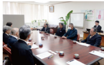
▲県生活福祉部への表敬・意見交換