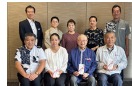
りゅうちゃん募金：第45回チャリティーいけばな展