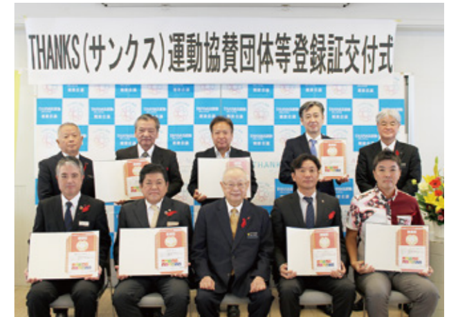
▲協賛団体登録証交付式 (R7 年 12 月)

令和 8 年 1 月現在、9 団体・1 個人にご加入いただいています。THANKS (サンクス) 運動推進会議事務局では、県内企業・団体の協賛団体への加入を募集しています。