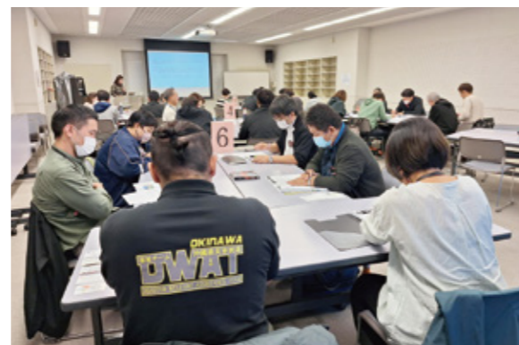
R7年度 DWAT おきなわスキルアップ研修の様子

また、保健・医療・福祉の各分野の専門職チーム (DMAT、DHEAT、DPAT等) との連携強化を目的に、県行政の各主管課と意見交換会を開催し、災害時における災害派遣福祉チーム (DWAT) の概要やその役割への理解を深めました。加えて、保健・医療・福祉の各専門職チーム同士の今後の連携の在り方として、メーリングリストの作成による迅速な情報共有や、相互の研修・訓練へのオブザーバー参加を通じ、平時から「顔の見える関係」を構築することを確認しました。今後、県社協としてもチーム員の増員と資質向上に努め、平時から多職種専門職チームとの関係づくりに取組み、災害時の多様な支援ニーズに対応できるよう、体制構築を進めてまいります。