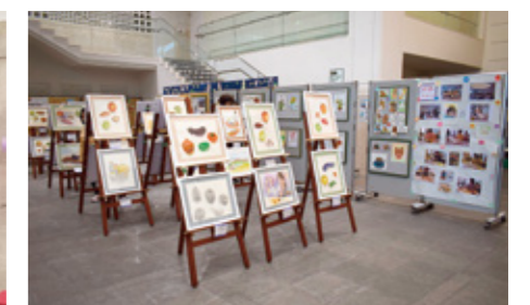
▲クラブ活動 (絵画クラブ)