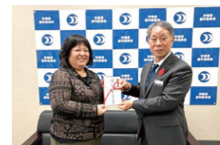
赤い羽根：(一社) 沖縄県歯科医師会