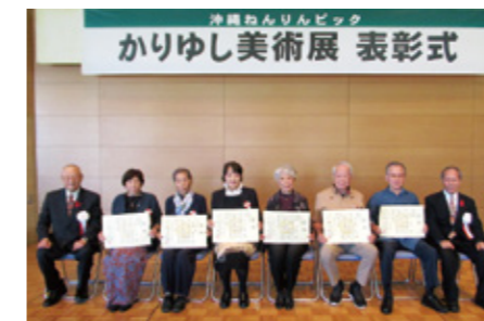
日本画部門受賞者