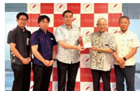
りゅうちゃん募金：沖縄ガス株式会社