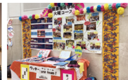
▲学科展示 (健康福祉学科 火曜日コース)