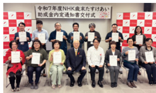
助成団体の皆さん