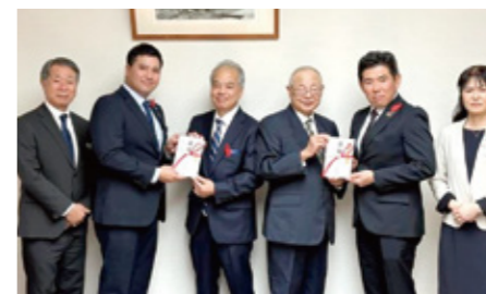
赤い羽根・歳末たすけあい：沖縄銀行