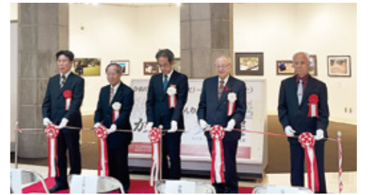
▲オープニングセレモニーテープカット

59歳以上のアマチュア作家の作品展示を行う「第16回沖縄ねんりんピックかりゆし美術展」が令和7年12月2日から6日まで、浦添市美術館で開催されました(主催:沖縄県、県社協)。6部門の計179点が展示され、県内外から延べ1,356人が来場しました。総受賞者数は56点、無鑑査1点、特別賞1点です。受賞された皆様、誠にありがとうございます!各部門上位2作品は、今年開催される第38回全国健康福祉祭埼玉大会に出品される予定です。