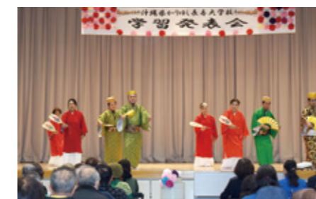
▲舞台発表 (地域文化学科 火曜日コース)

多様な人生経験を持つ学生が互いに学びあう、かりゆし長寿大学校ならではの素晴らしい学習発表会となりました。