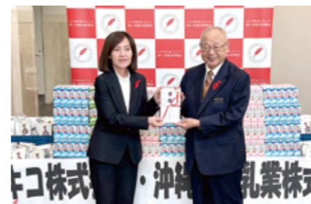
歳末たすけあい：オキコ株式会社