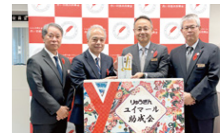
赤い羽根・歳末たすけあい：琉球銀行