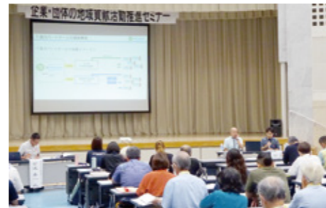
▲セミナーでの実践事例の報告

このセミナーは「地域でできること」を考え、課題の共有や協働事例を通して連携のヒントを得ることを目的に開催しました。企業・団体や社協、行政・福祉関係者などが参加し、実践例から今後の活動やネットワークづくりにつなげています。