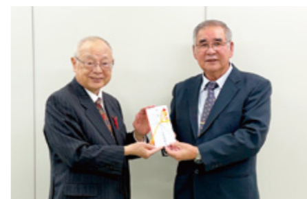
歳末たすけあい：(公社) 久米国鼎会