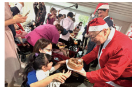
歳末たすけあい：沖縄製粉株式会社