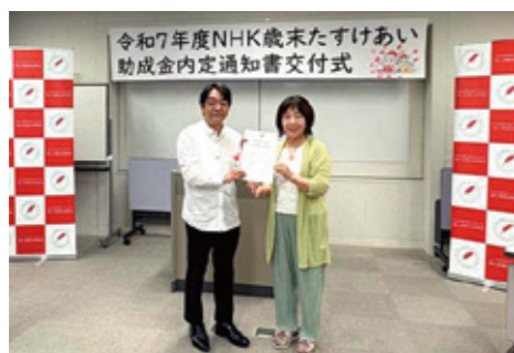
内定通知書の受け取り