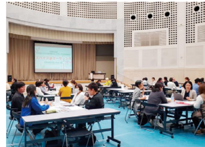
▲「スパイスミーティング」(R8 年 1 月)

沖縄県から委託を受け、地域の「こどもの居場所(こども食堂等)」の活動を支えることを目的に「こどもの居場所ネットワーク事業」を実施しています。