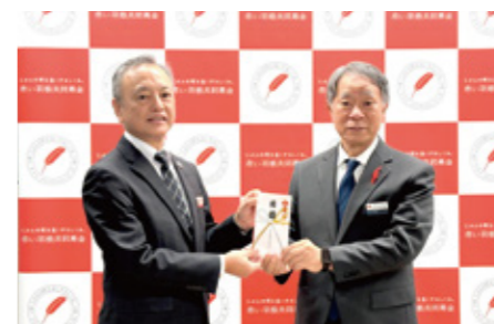
りゅうちゃん募金：沖縄県農林水産団体共済会