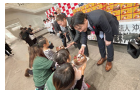
歳末たすけあい：(一社) 沖縄県洋菓子協会