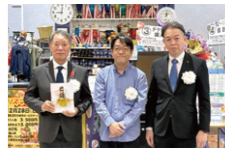
歳末たすけあい：沖縄県ボウリング場協会