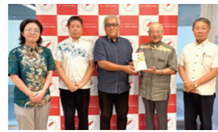
「愛ちゃんと希望くんのチムぢゅらさプロジェクト」： サントリーフーズ沖縄株式会社