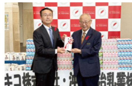
歳末たすけあい：沖縄明治乳業株式会社