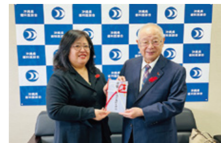
共同募金：沖縄県歯科医師会