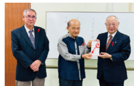
歳末たすけあい：久米国県会