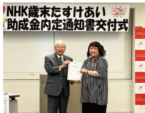
▲内定通知書の受け取り