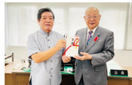
共同募金：沖縄県農林水産団体共済会