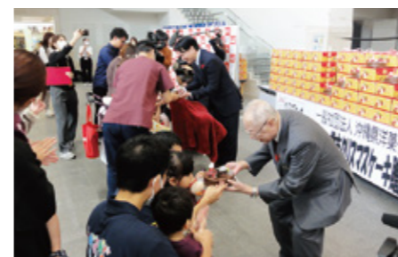
歳末たすけあい：沖縄県洋菓子協会