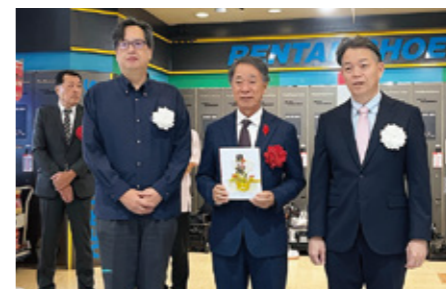
歳末たすけあい：沖縄県ボウリング場協会