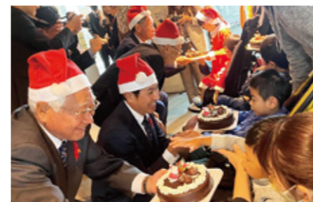
歳末たすけあい：沖縄製粉株式会社