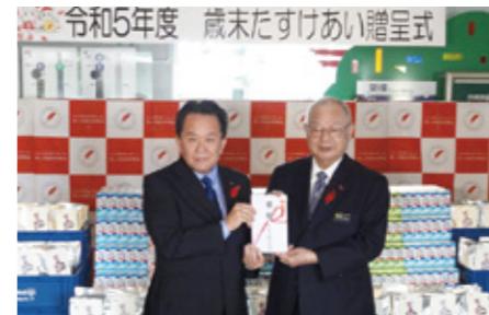
歳末たすけあい：オキコ株式会社