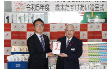
歳末たすけあい：沖縄明治乳業株式会社