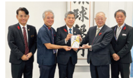
共同募金・歳末たすけあい：琉球銀行