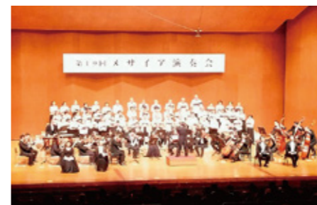
歳末たすけあい：メサイア演奏会