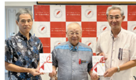
「愛ちゃんと希望くんのチムぢゅらさプロジェクト」: サントリーフーズ沖縄㈱・沖縄サントリー㈱