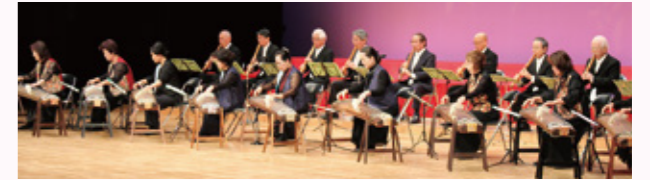
▲箏・尺八合奏 六段の調

チケットを御購入いただいた皆様、協賛広告に御協力いただきました17企業・団体の皆様に心より御礼申し上げます。