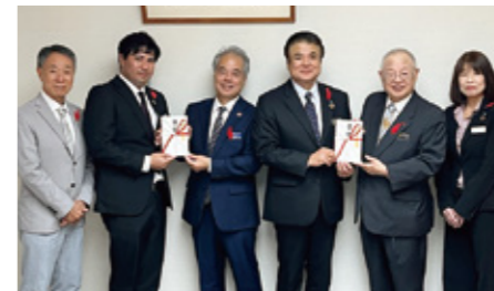
共同募金・歳末たすけあい：沖縄銀行