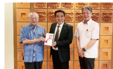
りゅうちゃん：第43回チャリティーいけばな展