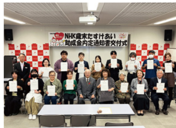
▲助成団体の皆さん