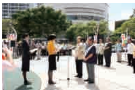
▲赤い羽根共同募金運動

⑤各支会・分会（共同募金委員会）や市町村社協連絡協議会が実施する広報イベントやセレモニーに積極的に参加協力をする。