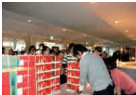
▲歳末物品ケーキ配分

社会福祉法人 沖縄県共同募金会 TEL 098-882-4353 FAX 098-882-4270 ホームページ http://www.okishakyo.or.jp/html/kyoubo/