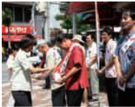
▲赤い羽根街頭募金