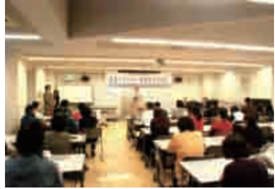
▲歳末たすけあい募金配分交付式