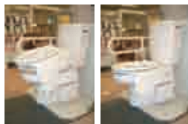
便座を上げた時 便座を下げた時

便座が上下し、トイレの、立ち座りをサポートする装置です。膝や腰が痛い方や下半身に力が入りにくい方は、便座への立ち座りが大変です。この装置は、そのような方の便座への立ち座りを楽にします。