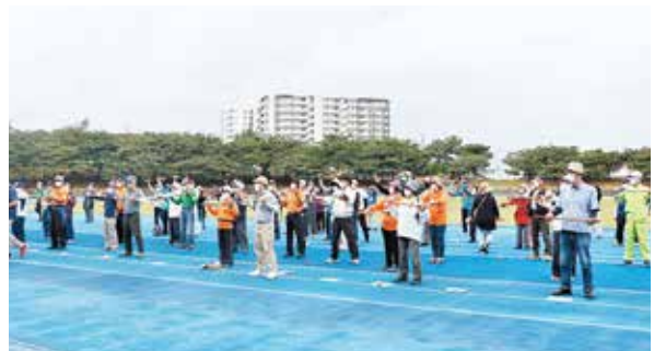
グラウンドゴルフ大会