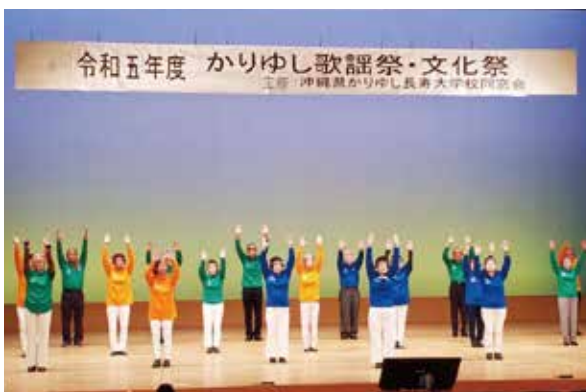
かりゆし歌謡祭・文化祭②