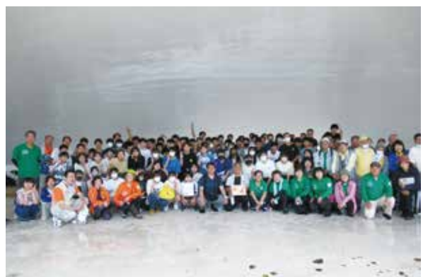
平和祈念公園美化活動