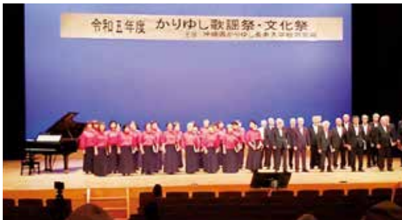
かりゆし歌謡祭・文化祭①