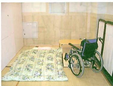
お試しルーム（4畳半）