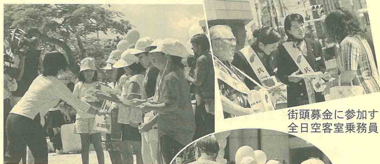
街頭募金に参加する全日空客室乗務員

皆様からいただきました募金は、それぞれの地域の社会福祉事業に役立てられます。県民皆様の温かい善意ありがとうございました。