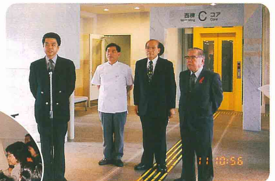
沖縄県洋菓子協会 クリスマスケーキ贈呈