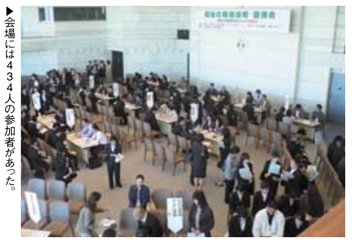
会場には434人の参加者があった。

障害者施設・保育園・社会福祉協会などの38参加事業所の施設団体コーナーにおいては、採用を前提とした求人面談を行い、求職者は積極的に施設と面談を行っていました。 各種相談コーナーにおいては、沖縄県看護協会、那覇公共職業安定所、沖縄公共職業安定所、福祉人材研修センター・バンクによる求人情報、福祉の資格取得のための情報提供などがありました。 参加者からは「施設のことを直接聞くことができてよかった」「丁寧な受け答えで相談しやすかった」などの感想がありました。